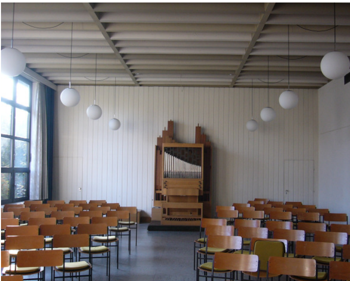
Kirchenraum vor Umbau - Westseite