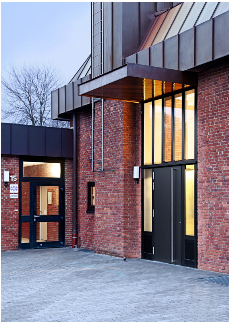
Neuer Zugang zur Kirche