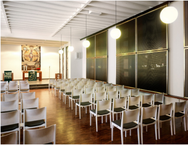
Kirchenraum nach Umbau - Blick zum Altar

Umbau und Modernisierung Projekt Gemeindezentrum Philipp-Melanchthon-Gemeinde Raunheim Ort Planung ab Dezember 2008, Datum Fertigstellung Oktober 2009 Vorentwurf, Entwurf, Ausführungsplanung, Leistung Ausschreibung, Bauleitung BGF 540qm Daten Baukosten 317.000 Euro