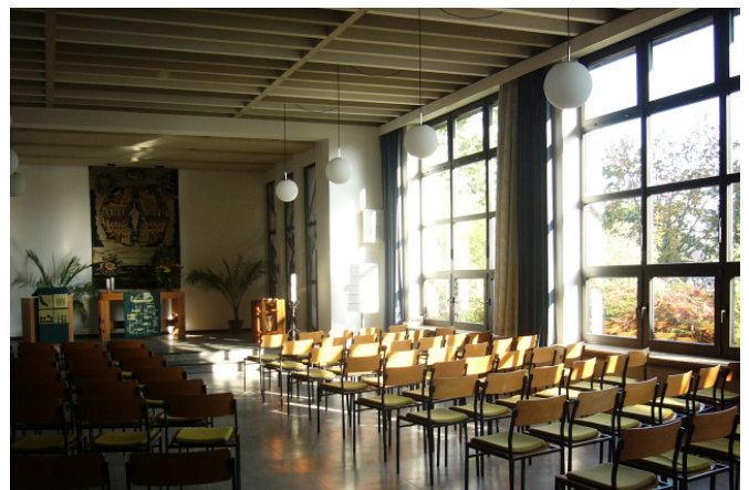
Kirchenraum vor Umbau - Blick zum Altar