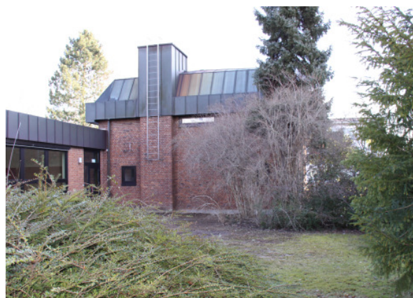
Westfassade vor Umbau - Bauarbeiten

Der frühere Eingangsbereich wurde mit großen Fensteröffnungen ausgestattet und bildet nun ein Foyer, dass sich zum Garten öffnet.