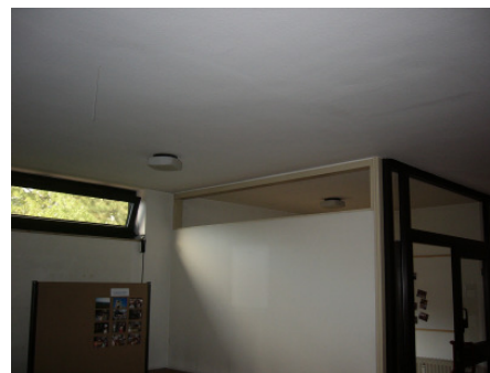
Haupteingang vor Umbau

Die bisher geschlossene Westfassade wurde geöffnet. Der Kirchenraum erhielt dadurch erstmals eine direkte Eingangstür im Sinne eines Westportals.