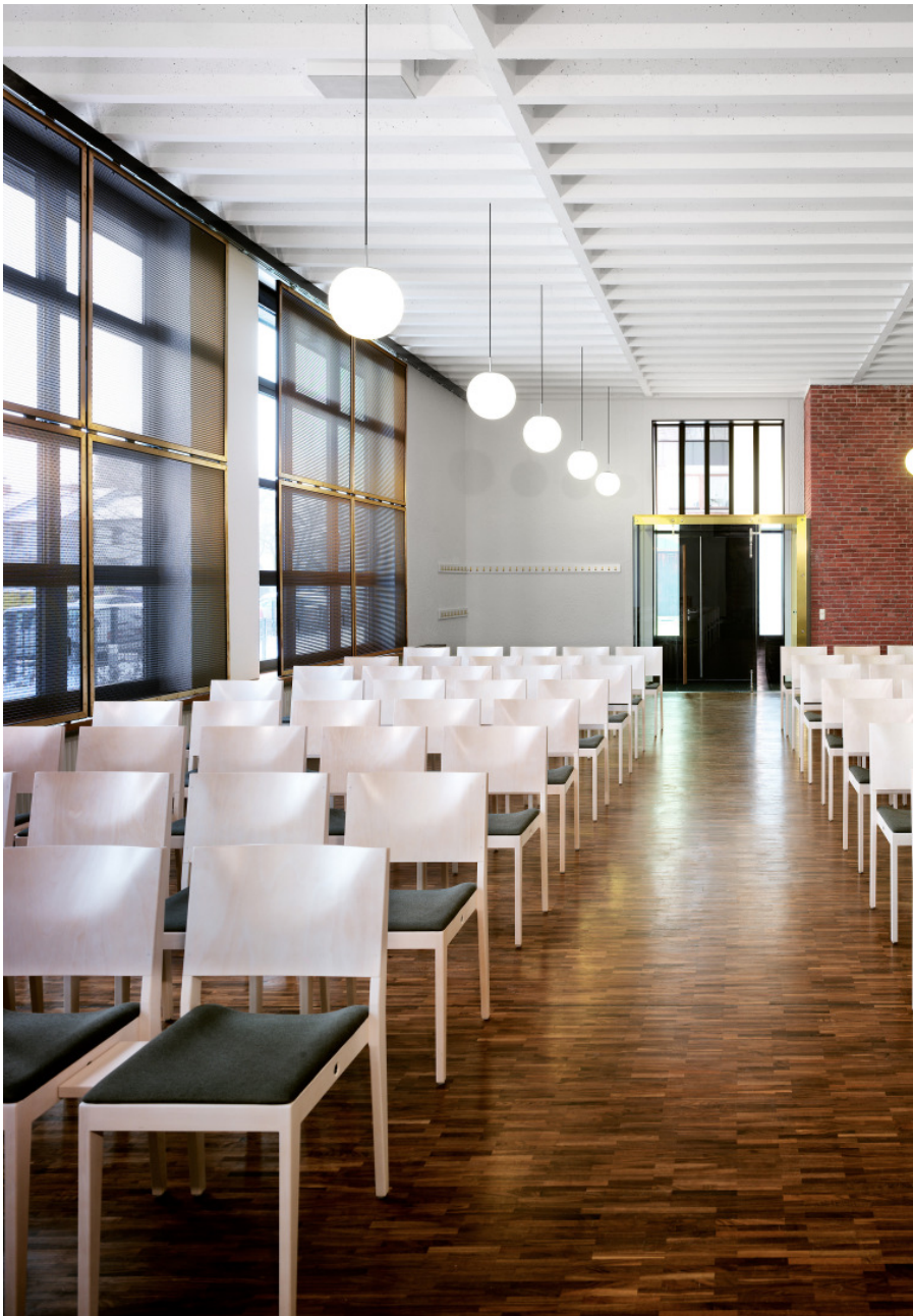
Kirchenraum nach Umbau - Blick zum neuen Eingang

Die Ausbaumaterialien bestimmen die Atmosphäre des Kirchenraums. Sichtschutz vor den großen Fenstern unterstützt die Konzentration auf den Altar.