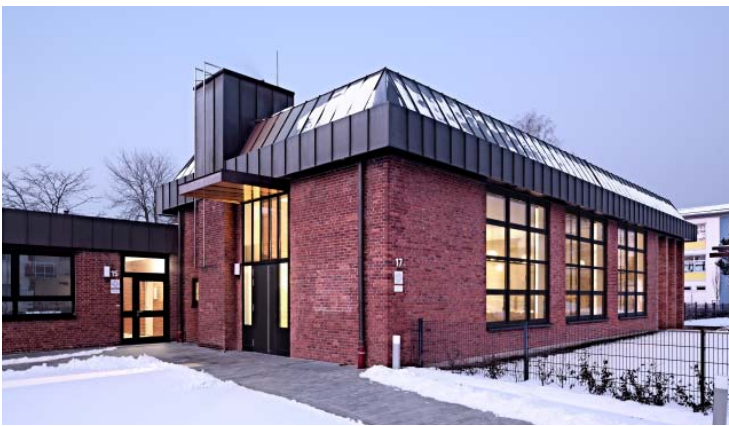
Blick auf Kirchenraum und neuen Vorplatz

Ein hoch liegendes Vordach, schmale Fenster, eine hohe Tür und ein reduziert gestalteter Windfang bilden die neue Eingangssituation zum Kirchenraum. Es wurde Wert darauf gelegt, dass sich die neuen Fassadenelemente in die Architektursprache des Bestandes einfügen.